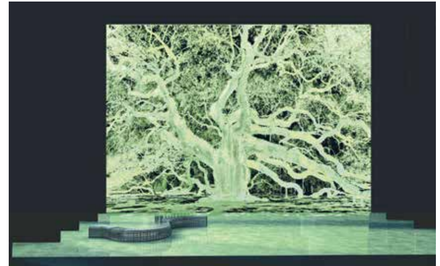
Les Jardins de l'Alcazar (acte II) : décor d'Andrea Blum, maquette informatique.