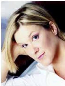
Alice Coote

Originaire du Cheshire, Alice Coote étudie le hautbois avant de se tourner vers le chant. Lauréate de plusieurs concours internationaux, elle affectionne tout particulièrement le récital et se produit sur toutes les grandes scènes internationales. Très appréciée pour ses interprétations de Mahler, Berlioz, Mozart, Haendel et Bach, elle collabore avec les formations les plus prestigieuses. A l'opéra, on a pu l'entendre entre autres dans Hercules , La Cenerentola , Le Couronnement de Poppée , Carmen , Così fan tutte , Le Viol de Lucrece , Pénélope , Giulio Cesare , Ariodante , Ariane à Naxos , Der Rosenkavalier , Idomeneo , La Clemenza di Tito . Parmi ses projets, citons Dream of Gerontius d'Elgar avec l'Orchestre