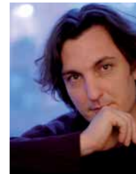
Ludovic Tézier

Après avoir fait ses armes à l'Opéra de Lucerne, Ludovic Tézier intègre la troupe de l'Opéra de Lyon. Il débute dans les grands rôles mozartiens mais aussi dans le répertoire belcantiste. Invité régulier des principales scènes internationales, on a déjà pu l'entendre dans les rôles de Hamlet, Wolfram (l'un de ses préférés), Onéguine, Le Comte, Don Giovanni, mais également Renato ( Un Ballo in Maschera ), Ford, Werther, Posa, Yeletski ( La Dame de Pique ) au Liceu, Enrico ( Lucia di Lammermoor ), Germont ( Traviata ). Il chante les rôles de Valentin ( Faust ) au Liceu, Yeletski à l'Opéra de Paris, Ford ( Falstaff ) au Capitole de Toulouse, Wolfram ( Tannhäuser ), Posa ( Don Carlo ) et Werther Vienne, Cléopâtre à Salzbourg, Marcello ( La Bohème ) à Orange,