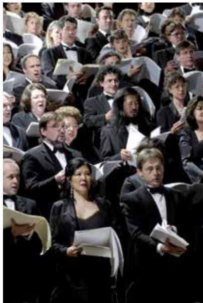
Chœur de Radio France

Le Chœur de Radio France est le seul chœur professionnel permanent à vocation symphonique en France. Il est le partenaire privilégié des trois autres formations de Radio France, l'Orchestre National de France, l'Orchestre Philharmonique de Radio France et la Maîtrise de Radio France. Son interprétation des grandes œuvres du répertoire lyrique et symphonique est mondialement reconnue. Au cours de sa longue histoire, les chefs d'orchestre les plus réputés l'ont dirigé : Désiré-Emile Inghelbrecht, Leonard Bernstein, Charles Munch, Karl Böhm, Marek Janowski,