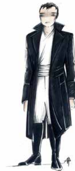
Costume de Fernand, dessin d'Aurore Popineau

G.P. Oui, tout à fait : par exemple, les poèmes des Orientales de Victor Hugo qui font référence à l'Espagne sont exactement dans cette veine fantasmagorique d'une Espagne tournant autour de la mort, des passions exacerbées et mystiques.