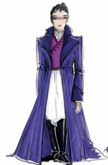
Costume d'Alphonse, dessin d'Aurore Popineau

Par ailleurs, pourquoi envoie-t-elle Inès pour informer Fernand au lieu d'y aller elle-même ? Je me suis