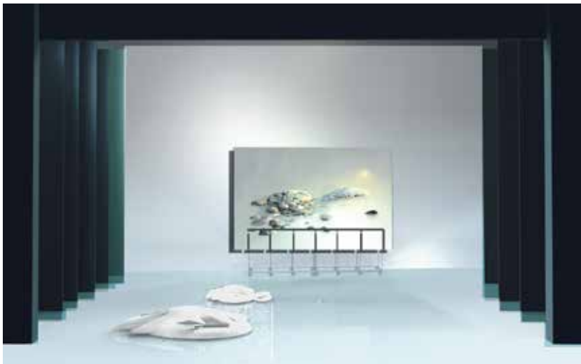
L'île de Léon (acte I, 2 e tableau) : décor d'Andrea Blum, maquette informatique.

V.N. Collaborer avec des gens brillants est infiniment précieux.. Et le rôle de l'assistant est différent à chaque fois selon le metteur en scène avec lequel il collabore, selon le régisseur, selon la présence ou pas d'un dramaturge... Concrètement l'assistant doit faire le lien entre le metteur en scène et tout le reste. C'est aussi une place d'où l'on peut apprendre beaucoup du metteur en scène que l'on voit au travail. Ayant une longue expérience du théâtre et étant professeur de théâtre, il ne s'agissait pas tellement pour moi de voir comment faisaient les metteurs en scène dans leur direction d'acteurs, mais de comprendre l'exigence absolue que l'on se doit d'avoir dans ce rôle : chaque détail compte, chaque chose sur le plateau doit être nécessaire et pensée. Être metteur en scène est donc aussi une angoisse et une responsabilité terrible que l'on connaît moins quand on est assistant ! Cette distance est d'ailleurs nécessaire à l'assistant, qui doit savoir se mettre dans la peau du spectateur pour juger de l'effet produit par la mise en scène, avoir s'il correspond ou pas au vœu du metteur en scène.