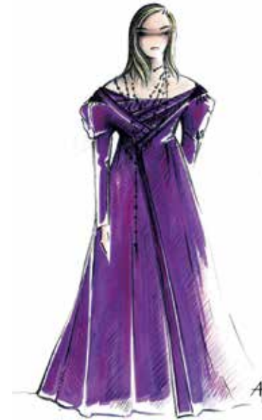
Costume de Léonor, dessin d'Aurore Popineau

France Musique diffuse cet opéra le samedi 23 février 2013 à 19h30.