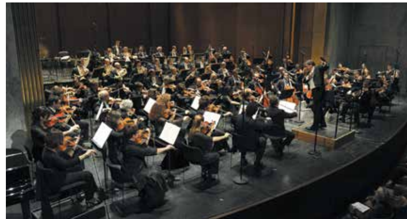
Orchestre National de France