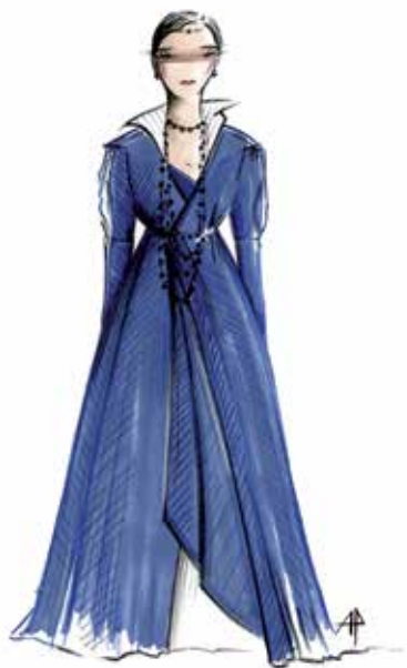
Costume d'une courtisane, dessin d'Aurore Popineau

Guillaume Poix : Quand par exemple Fernand se dit « malheureux, obscur et sans gloire », il prend les traits d'Hernani. Et la peinture des courtisans résonne elle aussi fortement avec celle proposée dans Ruy Blas .